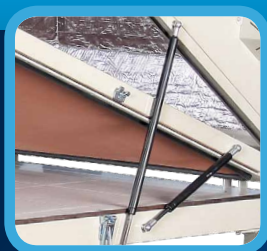
MECHANICAL OPENING MECHANICKÉ OTVÍRÁNÍ