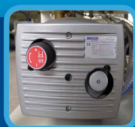
VACUUM PUMP BECKER VAKUOVÁ PUMPA BECKER