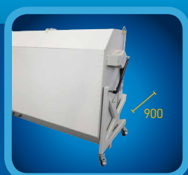
STORING WIDTH 900 MM ROZMĚR PO SLOŽENÍ 900 MM