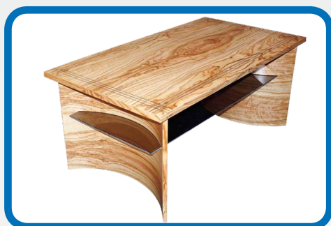
Veneered coffee table Dýhovaný konferenční stolek