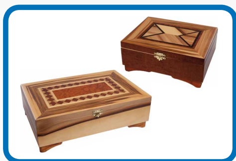
Jewelry box / Etui