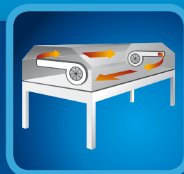
HEATING SYSTEM WITH VENTILATORS OHŘEV POMOCÍ VENTILÁTORŮ