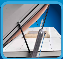
PNEUMATIC OPENING PNEUMATICKÉ OTVÍRÁNÍ