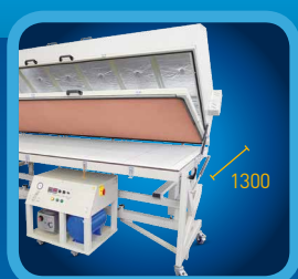
WORKING WIDTH 1 300 MM PRACOVNÍ ROZMĚR 1 300 MM