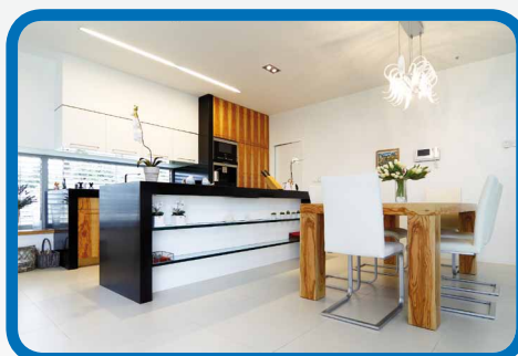
High gloss formica Umakart ve vysokém lesku