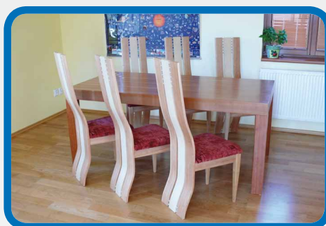
Dining table with chairs Jídelní stůl a židle