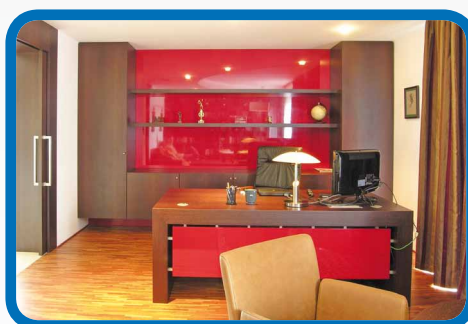
High gloss formica Umakart ve vysokém lesku