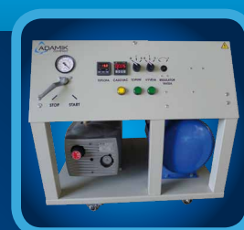
SELF STANDING CONTROL PANEL VOLNE STOJÍCÍ OVLÁDACÍ PANEL