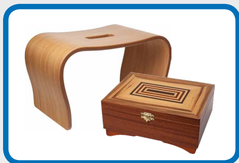
Shaped furniture and jewelry box Ohýbaný nábytek a etui