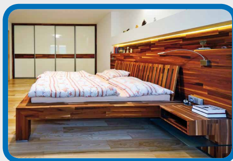
Exotic veneer / Exotické dýhy